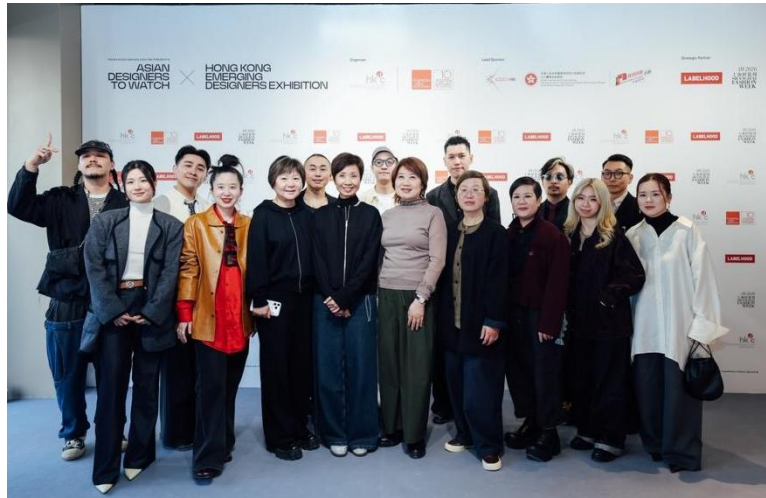
10 位香港新銳設計師與主禮嘉賓合影 2

此次香港設計中心登陸上海時裝周，不僅是滬港創意產業交流的重要實踐，更是香港「超級聯繫人」定位在時尚領域的生動體現。Fashion Asia 的「亞洲十大焦點設計師」為內地市場帶來了多元的亞洲時尚視角，而十位香港新銳設計師則展現了香港本土創意的新生力量，二者同台亮相，不僅促成了亞洲設計與香港設計的創意聯動，更搭建了香港設計力量與內地市場的商業橋樑。在文創處的支持下，香港設計中心將繼續持續推動香港與內地、亞洲，以及全球的創意產業交流，培育更多優秀的設計人才，釋放設計的商業價值與文化價值，助力香港打造世界級創意之都，並讓香港設計力量在更廣闊的市場中持續突破與發展。