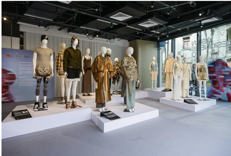
2025 「亞洲十大焦點設計師」七位傑出設計師設計展示空間

Fashion Asia 作為亞洲時尚領域的重要標桿，此次攜 2025 「亞洲十大焦點設計師」中七位傑出設計師登上 2026 秋冬上海時裝周，集中展現亞洲設計的多元魅力與創新力量。這次參與亦再次印證了 Fashion Asia 致力推動亞洲設計跨區域交流的承諾。參展設計師及品牌來自中國內地、香港及韓國，包括：