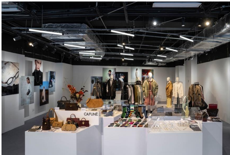
十位香港新銳設計師設計展示空間

香港設計中心首度帶領香港新銳設計師登上上海時裝周，聚焦香港本土新晉設計力量，集結十位香港新銳設計師及品牌，以兼具本土特色與國際視野的設計作品，展現香港新生代創意的無限可能，為滬港時尚交流注入全新活力。這場專屬時尚展將全方位呈現香港新晉設計師在時裝、配飾等領域的創意突破，成為香港新銳設計力量拓展內地，乃至全球市場的重要契機。參展的十位設計師包括：