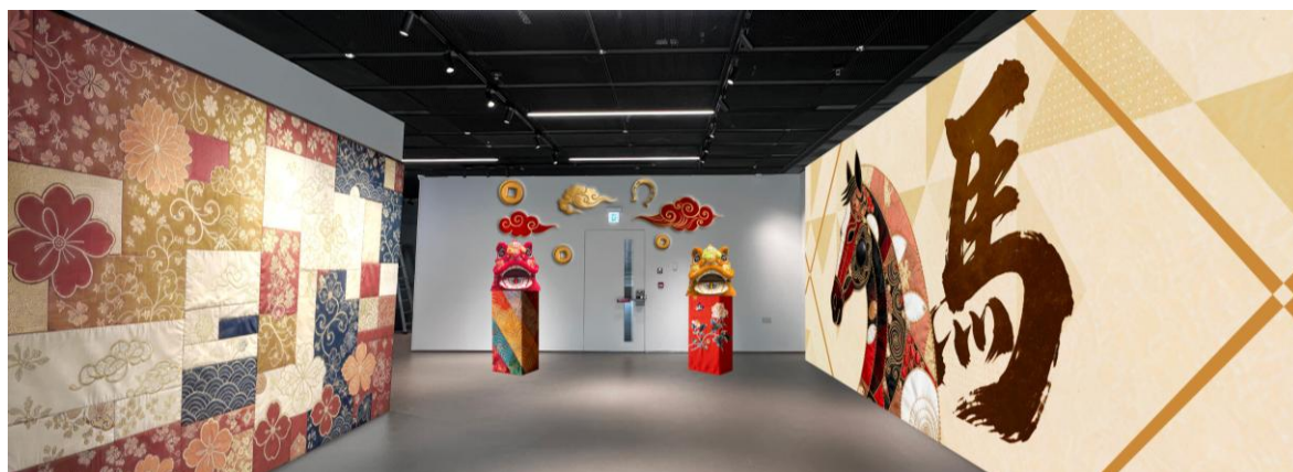
互動許願牆參考圖