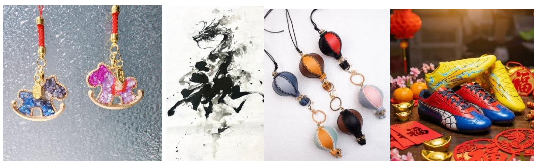
工作坊參考圖，左至右：

一系列馬年主題的工作坊由專業設計師及藝術家親自指導，參加者可親手創作獨一無二的新春禮物，體驗設計的樂趣與可能。無論設計愛好者或初學者，都能在互動交流中拓展美學視野。